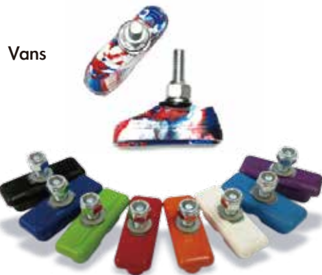
Composite Continental Pads