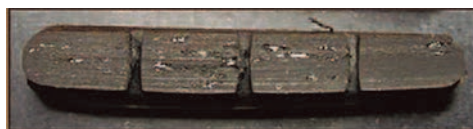
它牌煞車皮，使用後