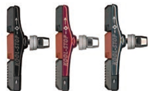
KS-TEC KS-TECR KS-TECS

Tectonic剎車片是一種鍛造合金支架，允許騎手自定煞車皮的準確位置。煞車皮設計成互鎖在一起，並側面固定到支架中。Pad-Lock™ 墊圈系統凸面樞軸調節納入到背板進行了改進；因此可實現所有間距要求所需的墊圈數量。Tectonic採用多摩擦化合物設置，但也可以配置單或雙材煞車皮。